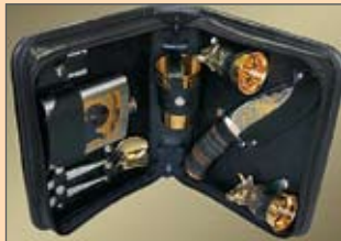
«Русский элитный подарок», г. Москва www.elitegift.ru

Контактную информацию нашей фирмы Вы можете найти в Классификаторе сувенирной и канцелярской продукции, в рубрике «Наборы для пикника», «VIP-подарки».