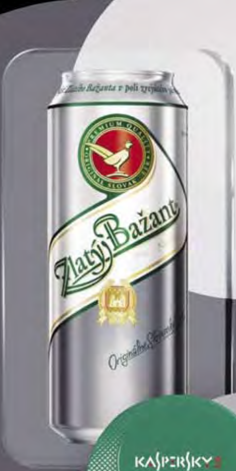
Примеры персонализации полноцветная запечатка в коврик