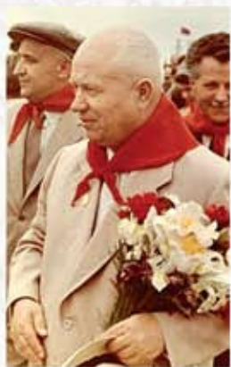
Никита Сергеевич Хрущёв

Первый секретарь ЦК КПСС с 1953 по 1964 годы, Председатель Совета Министров СССР с 1958 по 1964 годы. Герой Советского Союза, трижды Герой Социалистического Труда. 19 февраля 1954 года Президиумом Верховного Совета СССР был принят указ о передаче Крымской области из состава РСФСР в состав УССР. Благодаря этому документу Крым был, фактически, подарен Хрущевым Украине.