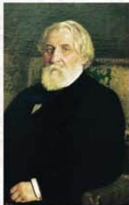
Иван Сергеевич Тургенев:

«Берегите наш язык, наш прекрасный русский язык, этот клад, это достояние, переданное нам нашими предшественниками... Обращайтесь почтительно с этим могущественным орудием, в руках умелых оно в состоянии совершить чудеса. Берегите чистоту языка, как святыню. Никогда не употребляйте иностранных слов. Русский язык так богат и глубок, что нам нечего брать у тех, кто беднее нас».