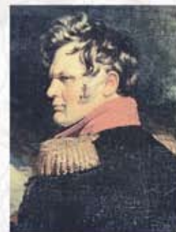
Алексей Петрович Ермолов

Второй непростительной ошибкой первого президента России я считаю ничем не оправданное дарение Украине Крыма. Лавры Хрущёва его что ли смущали? Крым никогда не был частью Украины (кроме уже помянутого подарка Хрущёва), и на