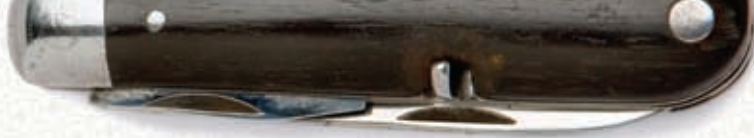
Replica 1891 Limited Edition 125 Anniversary