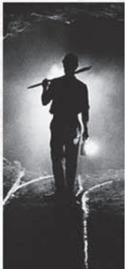
Шахтер — самая опасная «мирная» профессия. Каждый добытый миллион тонн полезных ископаемых обходится в среднем в четыре человеческие жизни.