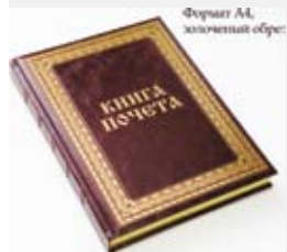
Формат А4, золоченый обложка

Рады сообщить, что компания «Кожаная мозаика» начала производство Книг Почета и Гостевых книг по классической технологии французского переплета. При изготовлении обложки используется натуральная импортная кожа высокого качества; блокшивается вручную из дизайнерской бумаги; обрез блока золотится с трех сторон. Возможны различные форматы, цвет, дизайн, нанесение логотипа. Уровень исполнения: Бизнес и VIP.